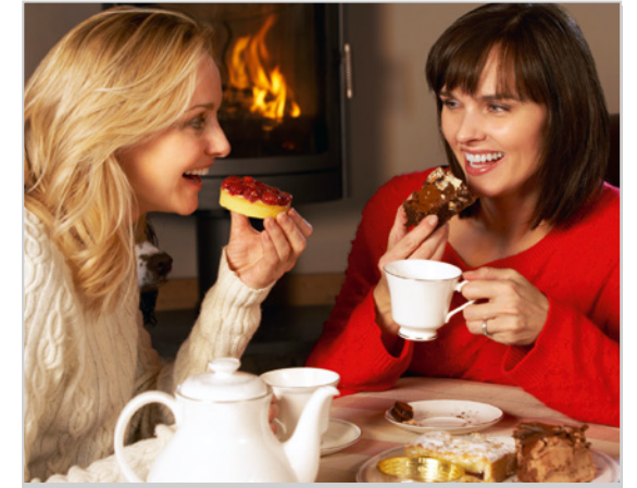
Himbeeren schmecken nicht nur auf dem Kuchen lecker, sondern sind auch gut für die Haut

Fragen Sie Ihre Freundinnen beim nächsten Treffen doch mal nach ihren Tipps für einen guten Schönheitsschlaf. Wie sieht ihre abendliche Pflegeroutine aus? Geben Sie die Tipps aus diesem Handbuch weiter und erzählen Sie, wie das Boots Laboratories SERUM 7 Active Night Oil Ihre Haut am nächsten Morgen strahlen lässt.