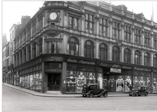
Das erste Boots-Geschäft im englischen Nottingham 1849