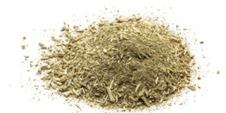
Die Rinde des chilenischen Boldo-Baumes